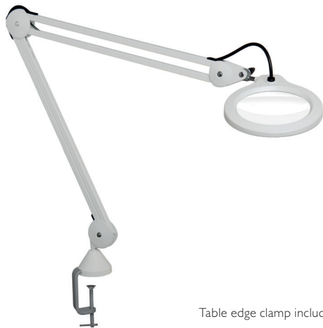
Table edge clamp included