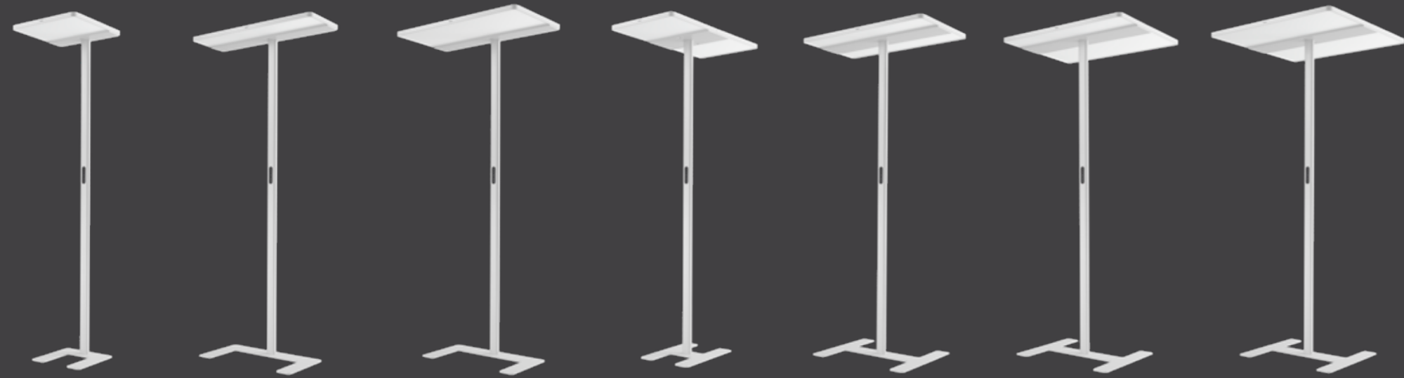
1DS 1 Desk Side